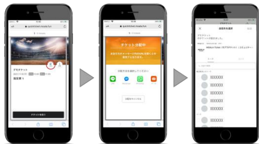
分配ボタンをタップ