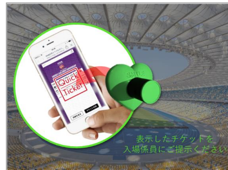
表示したチケットを 入場係員にご提示ください