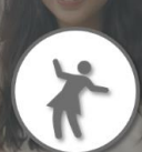
忘れてしまった場合 ご入場いただけません。