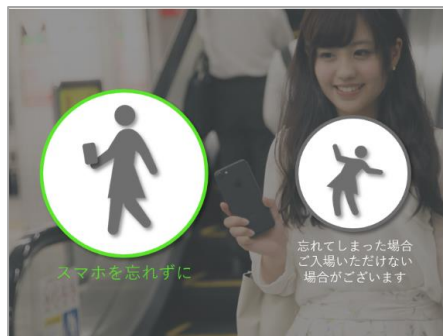
スマホを忘れずに